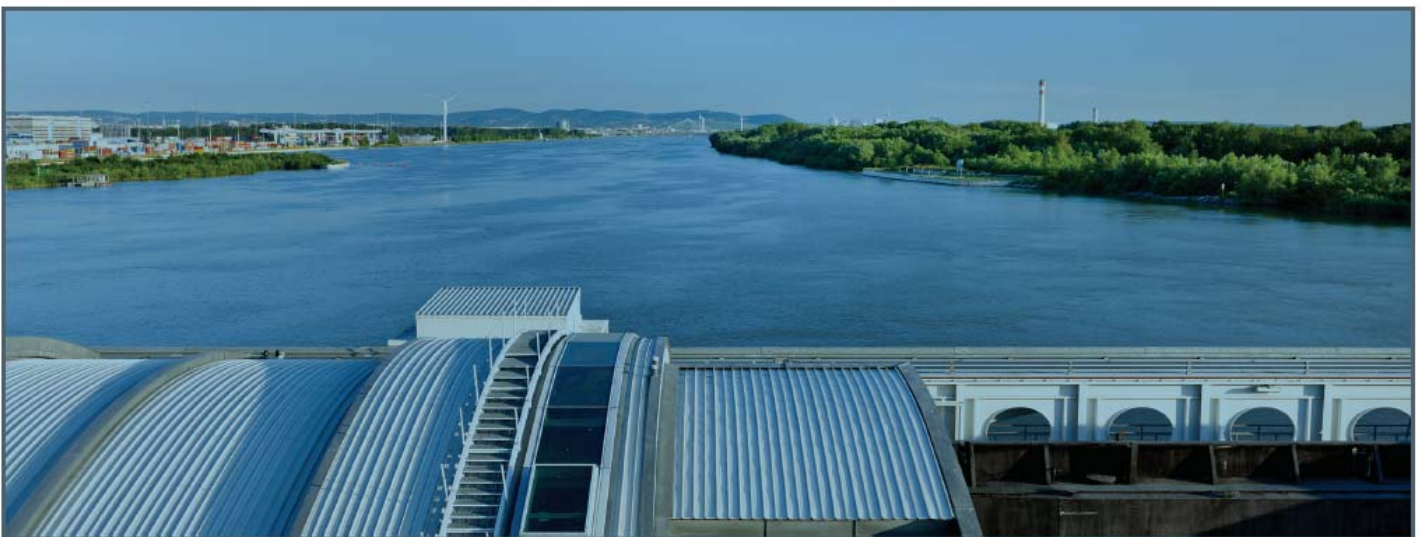
VERBUND-Kraftwerk Freudenau bei Wien