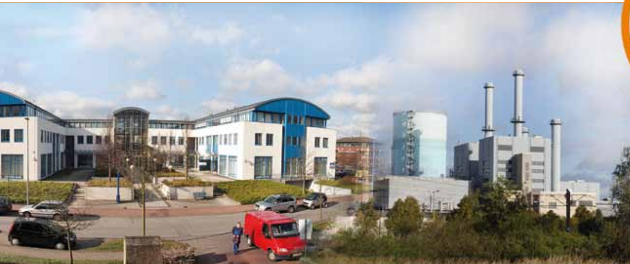
Die ersten Büros der Stadtwerke Schwerin befanden sich in der Wismarschen Straße. Seit Januar 1995 haben die Stadtwerke mit ihren angeschlossenen Gesellschaften ihren Sitz im heutigen Domizil Eckdrift 43-45