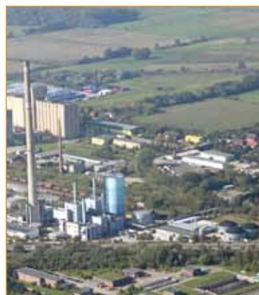
Ökologisch und effizient: der Energiestandort Schwerin-Süd

Aus den zwei ehemaligen Heizwerken, eins kohle- und eins schwerölbefeuert, entstanden umweltfreundliche, erdgasbetriebene GuD-Heizkraftwerke. Die modernen Gas- und Dampfturbinen, die nach