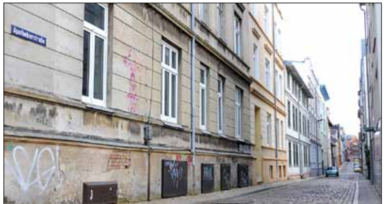
Die Erneuerung der Hausanschlüsse und Leitungen wird aufgrund der extremen Engstellen der Apothekerstraße eine Herausforderung

Bauarbeiten beginnen Mitte Mai in der Apothekerstraße und werden 2012 in der Bergstraße fortgeführt