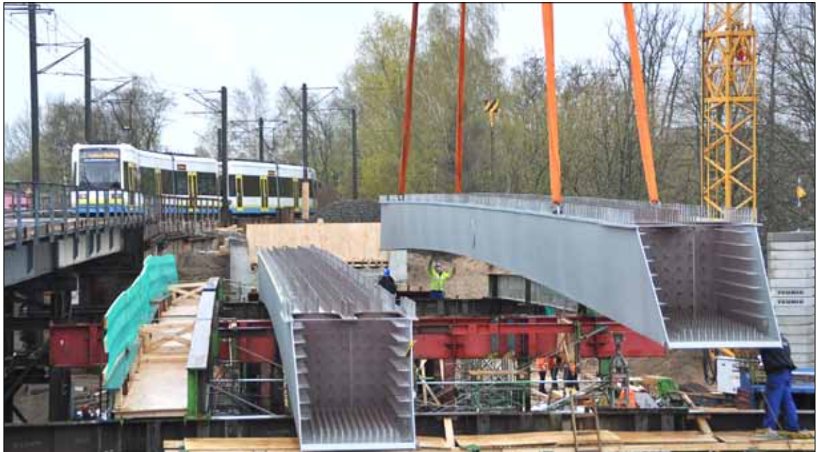
Mit schwerem Gerät wurden die beiden Stahlträger für die neue Brückenkonstruktion an ihren Platz über die Crivitzer Chaussee positioniert. Trotz starkem Wind, der die Arbeiten kompliziert machte, verlief alles nach Plan

Arbeiten an Straßenbahnbrücke über die Crivitzer Chaussee gehen voran