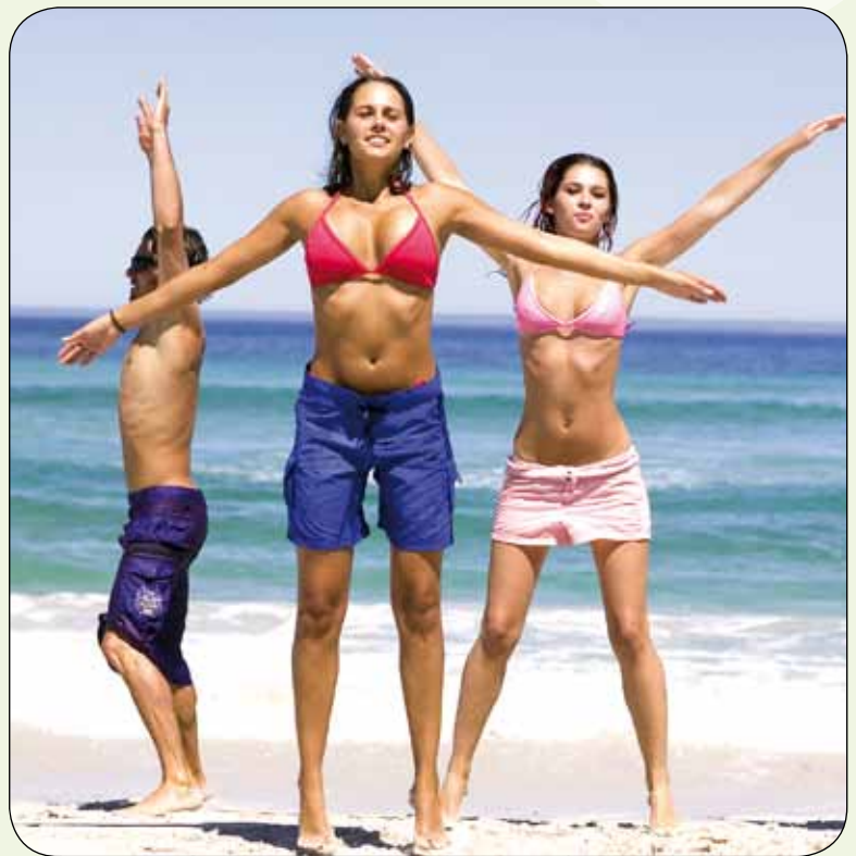
Wer am Strand mit einem durchtrainierten Körper glänzen will, kann sich im belasso für eines der super Last-Minute-Angebote anmelden

Es gibt aber auch andere Wege. Das Trainingssystem Milon Zirkel bringt schon nach wenigen Workouts spürbare Ergeb- nisse. Durch eine elektronische Steuerung des Gesamtwiderstandes werden Muskeln in jeder Phase des Trainings optimal belastet. Damit trainieren Besucher des belasso bis zu 30 Prozent effektiver als mit herkömmlichen Methoden. Ein Durch- gang dauert zwei Mal 17,5 Minuten. „Bereits bei zwei Einheiten in der Woche werden sichtbare Fortschritte erzielt“, so Andreas Kalbe. Das Zirkeltraining bringt