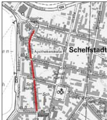
Der Austausch beginnt in der Apothekerstraße Grafik: Ingenieurbüro BAUWAS GmbH

Damit sich die Stoffe am Boden des Beckens absetzen, wird die Fließgeschwindigkeit des Abwassers weiter herabgesetzt: auf ungefähr einen Zentimeter pro Sekunde. Die Stoffe, die schwerer sind, sinken nach unten - sie sedimentieren -, leichtere schwimmen nach oben, das heißt sie flotieren . Die sich am Boden ablagernden Substanzen bilden den Primärschlamm . Sogenannte Räumer , die man sich als eine Art Laufband vorstellen kann, schieben die Stoffe über einen Schlammtreiter heraus. Bei starken Regenfällen werden die Vorklärbecken entlastet, indem das Abwasser in Zwischenspeichern gesammelt wird. Bis Anfang der 90er-Jahre war die Abwasserreinigung hier beendet. 1993 wurde die biologische Reinigungsstufe in Betrieb genommen - und damit wird es richtig interessant! In der nächsten Folge ist mehr über diese weitere Reinigung des Abwassers zu erfahren. mw