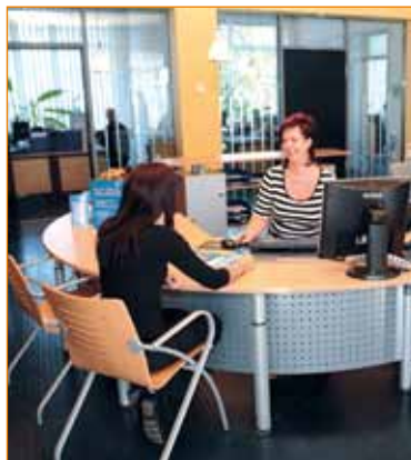
2001 öffnete das neue Kundencenter in der Geschäftsstelle Eckdrift

Neben den anspruchsvollen technischen Entwicklungen setzen die Stadtwerke seit Jahren auch auf eine kontinuierliche Verbesserung des Kundenservices. Unter dem Motto „Natürlich jeden Tag“ sind die Stadtwerke rund um die Uhr für ihre Kunden da. Einen persönlichen Ansprechpartner